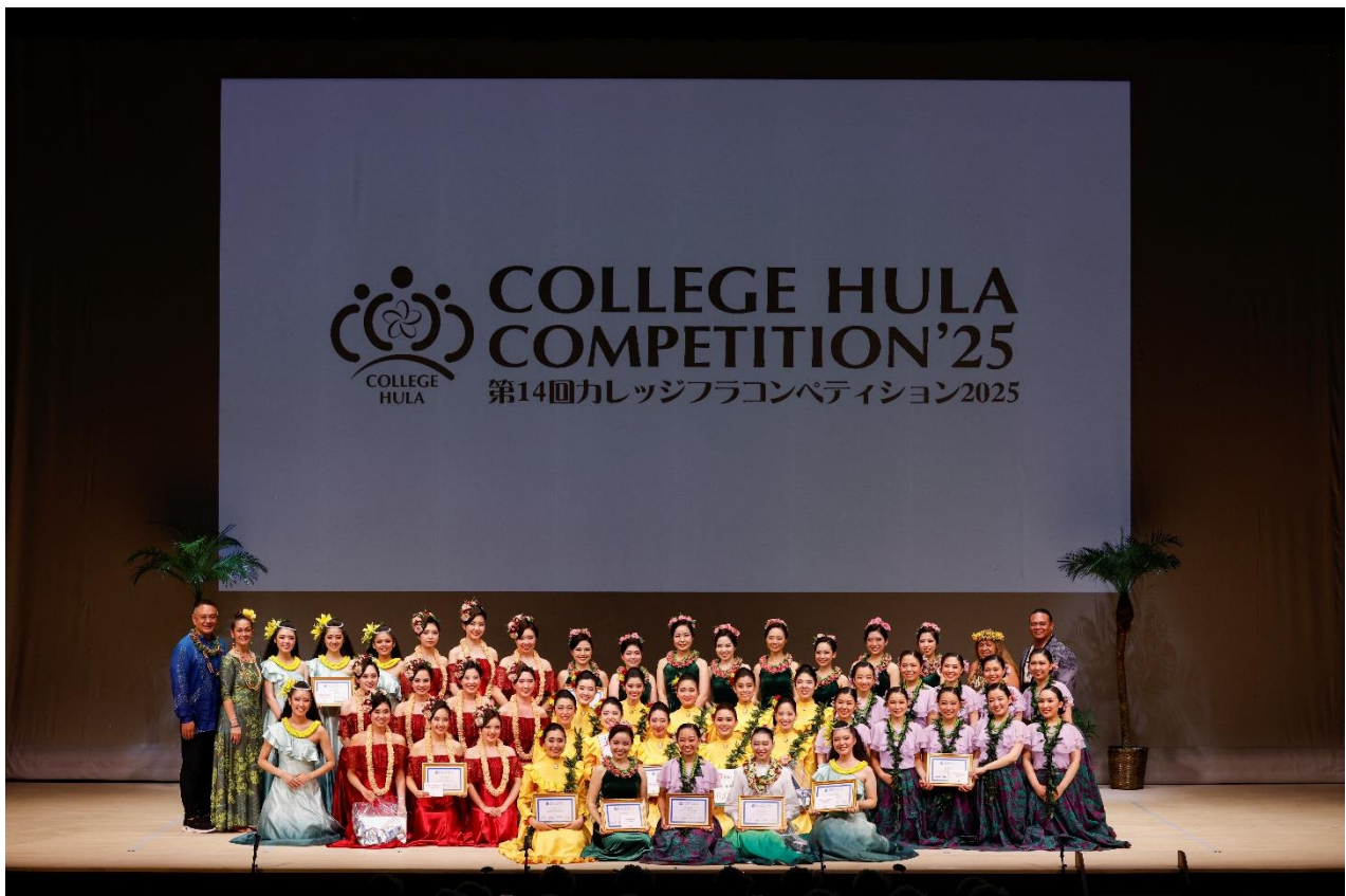
第 14 回 カレッジフラコンペティション 2025