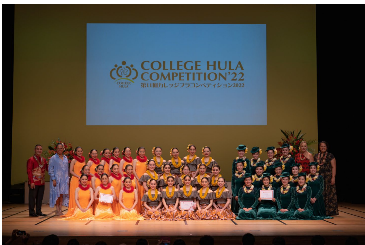
第11回カレッジフラコンペティション2022