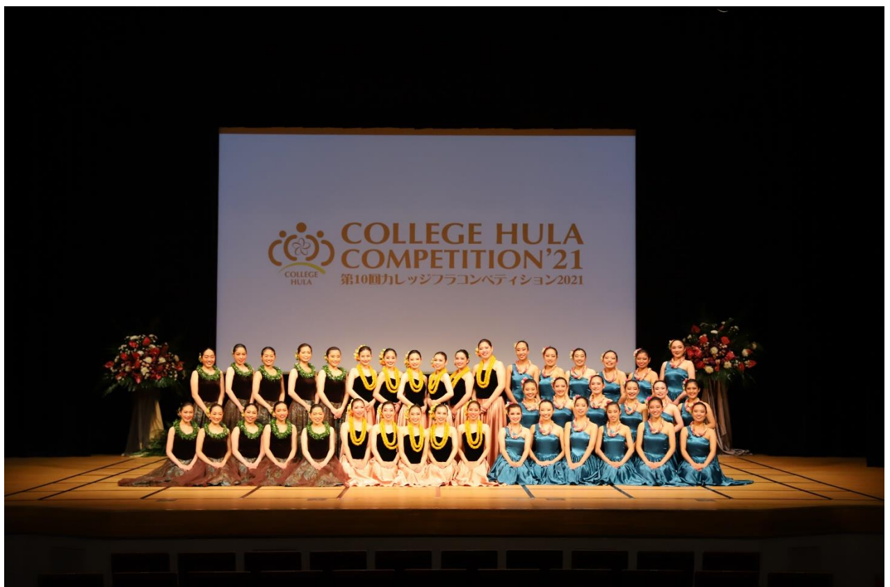
第10回カレッジフラコンペティション 2021