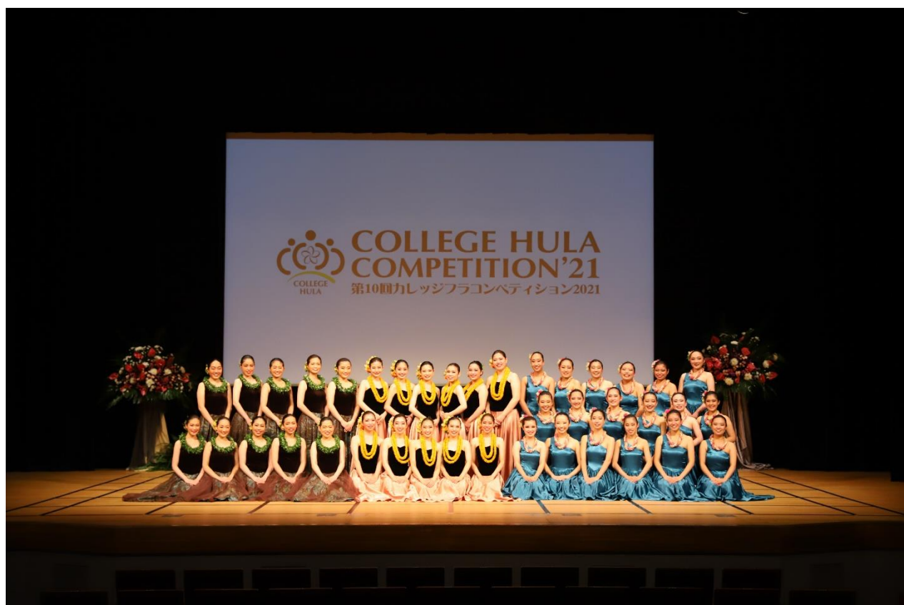
第10回カレッジフラコンペティション2021